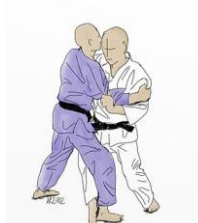
KO UCHI GARI