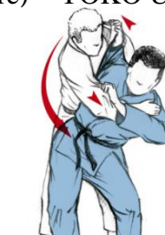
TSURI KOMI GOSHI