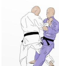
O UCHI GARI