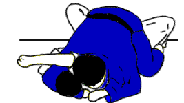
KUZURE TATE SHIO GATAME

2 Sortie d'Immobilisation au choix – 2 Retournements de UKE à plat ventre / 6