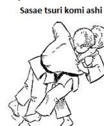
SASAE TSURI KOMI ASHI