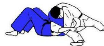
MAKURA GESA GATAME

TORI et UKE attaquent et défendent à tour de rôle / 4