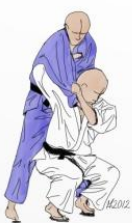
MOROTE SEOI NAGE

(Chute avant) – USHIRO UKEMI (Chute arrière) – YOKO UKEMI (Chute latérale) / 3