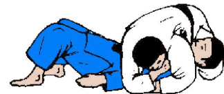
KUZURE YOKO SHIO GATAME