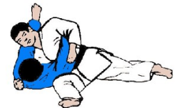
KUZURE GESA GATAME