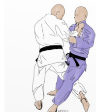
O UCHI GARI