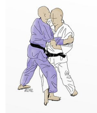
KO UCHI GARI