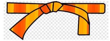
KIRO - ORENJI