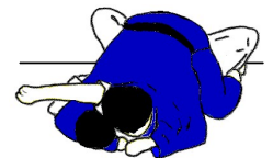
KUZURE TATE SHIO GATAME