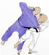
O SOTO GARI