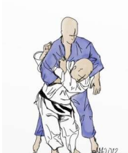
IPPON SEOI NAGE