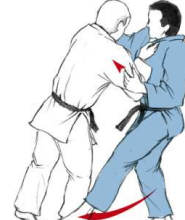
DE ASHI BARAI